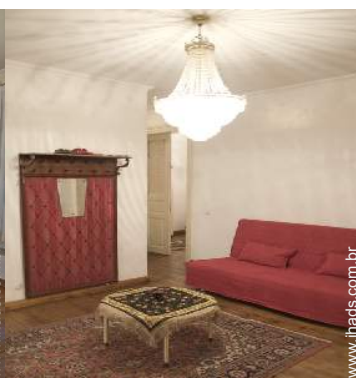
possibilidade de cama(s) extra(s)