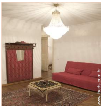
possibilidade de cama(s) extra(s)