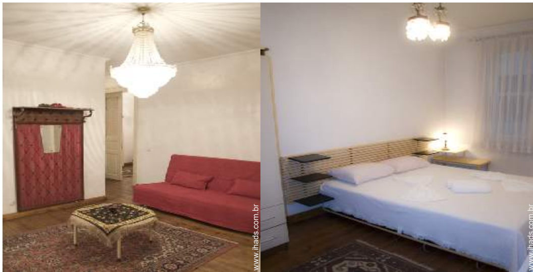
possibilidade de cama(s) extra(s)