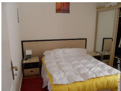
Conforto interior e equipamentos