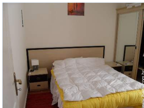
Conforto interior e equipamentos