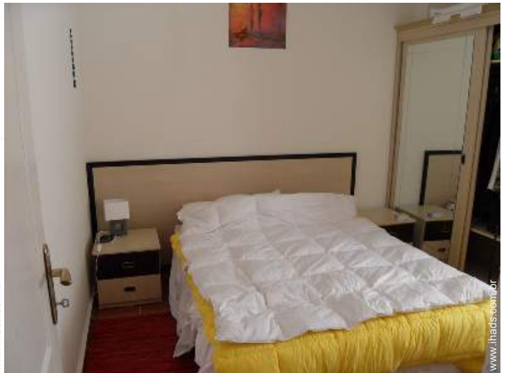
Conforto interior e equipamentos