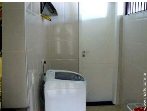
quarto de serviço