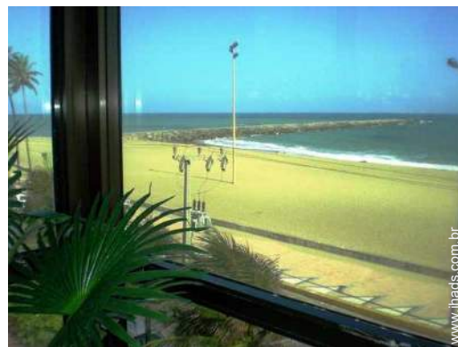
vista a partir da sala de jantar