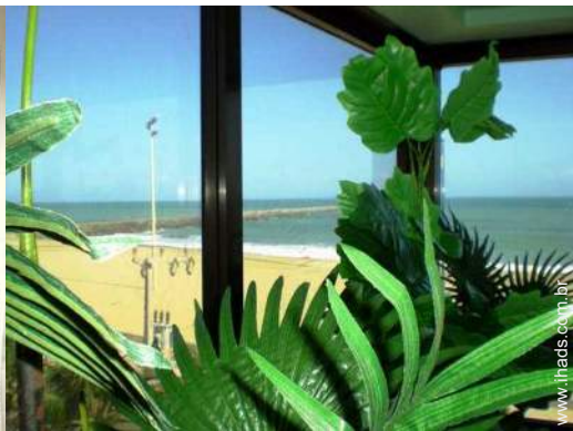
vista a partir da sala de jantar