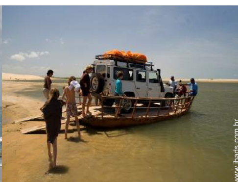
actividades nas proximidades