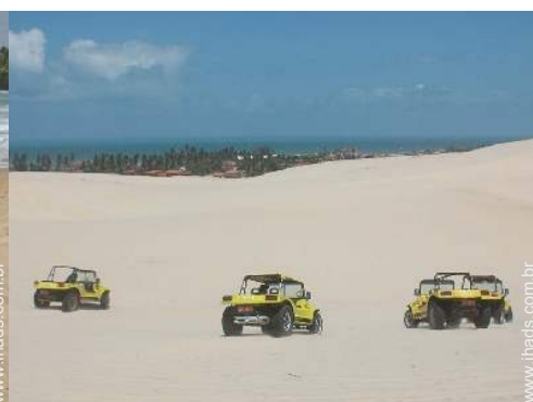
actividades nas proximidades