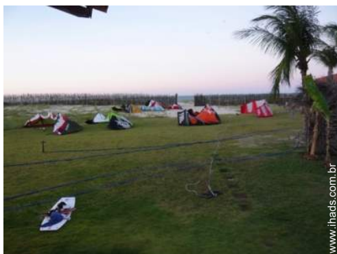
acesso directo à praia