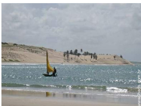
actividades nas proximidades