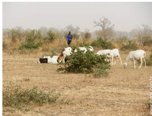
vista de campo