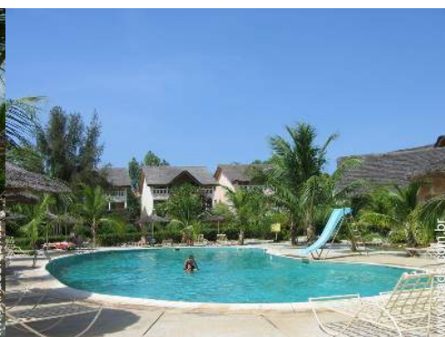
piscina na residência