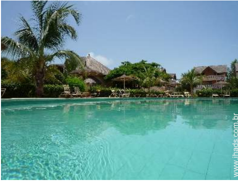
piscina na residência