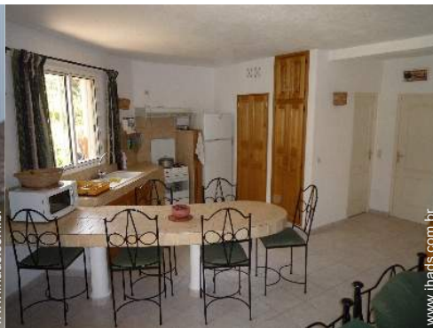
grande cozinha americana