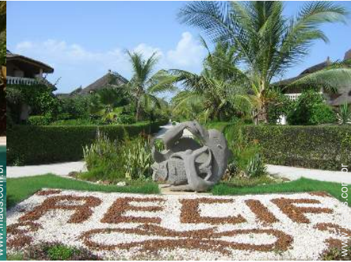
Aldeamento de qualidade