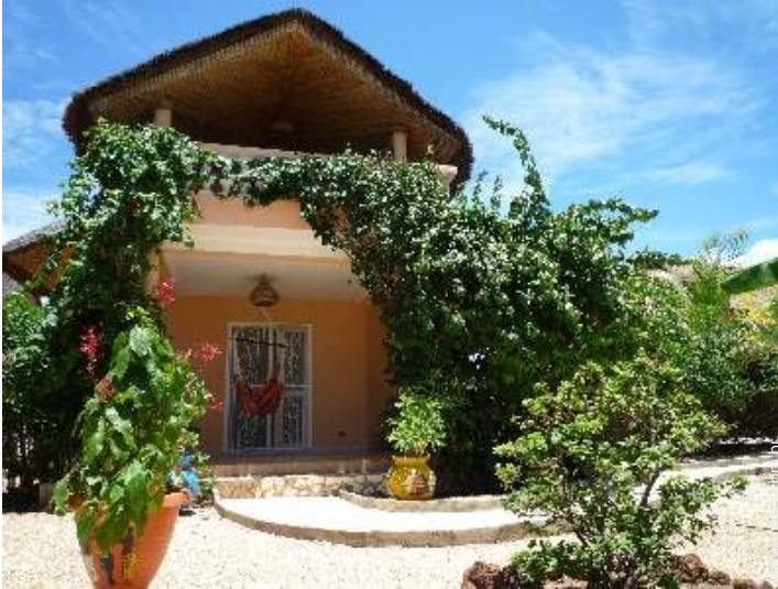
loja de artesanato