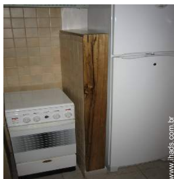
fogão a gás