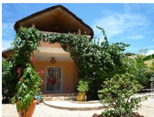
loja de artesanato