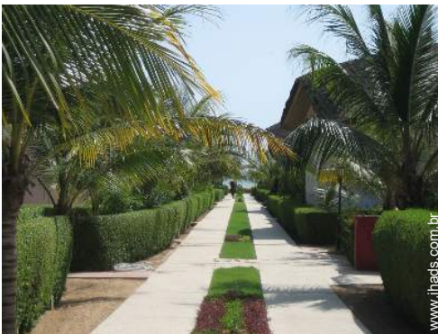
Aldeamento de qualidade