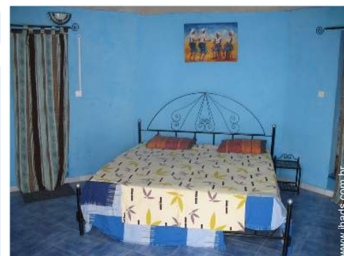
quarto de amigos

Salão de verão, barbecue, mesa(s) de jardim, cadeira(s) de jardim, 1 cama de rede