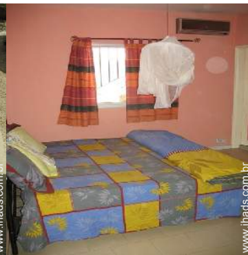
quarto do proprietário