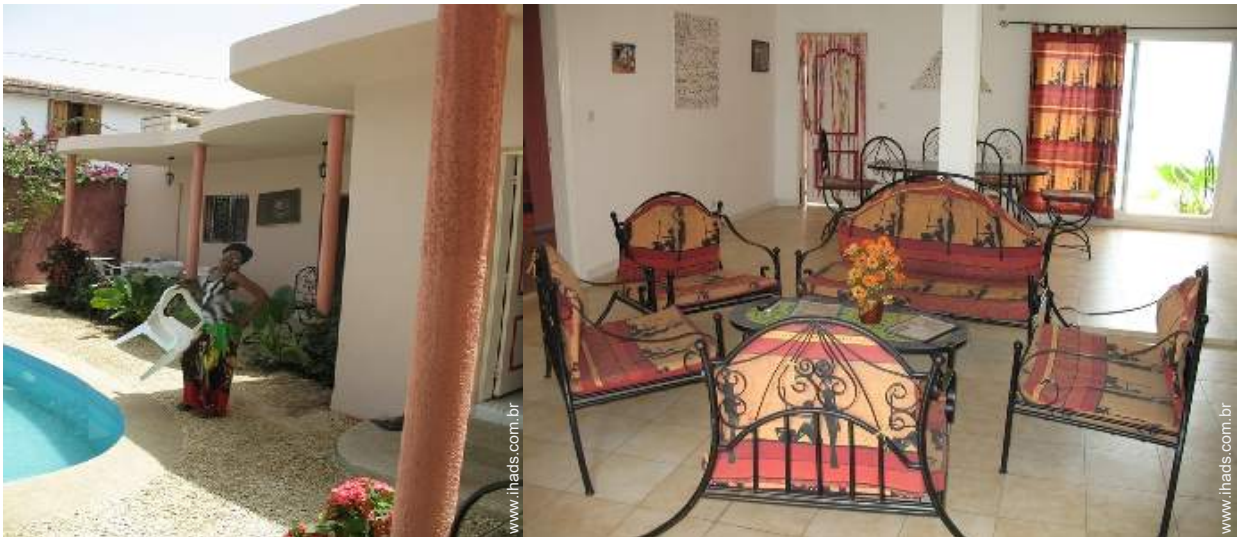
vista a partir do terraço coberto