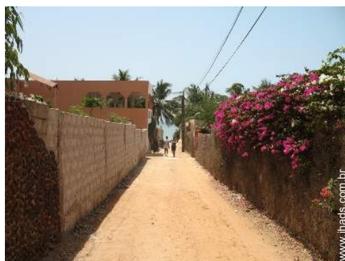
Atrações e lazer