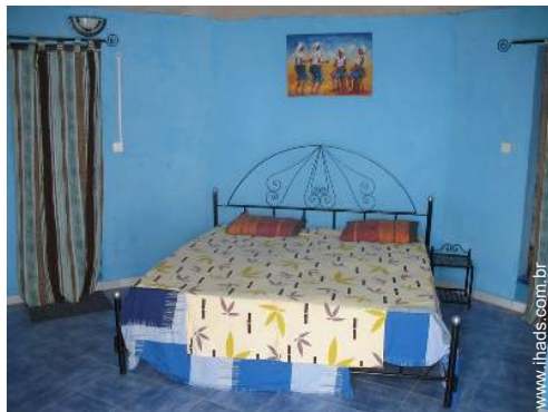
quarto de amigos