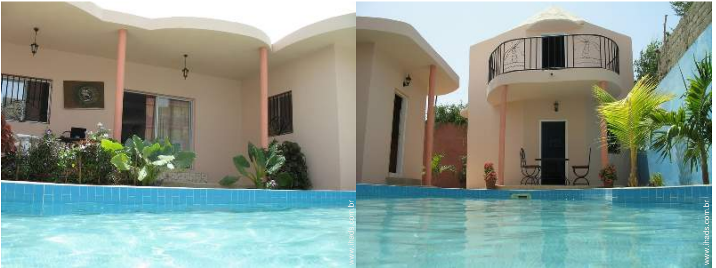
vista a partir da piscina