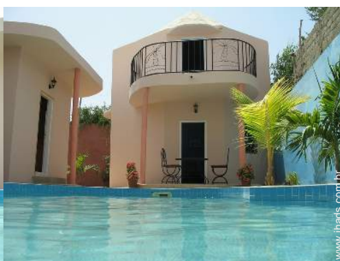
vista a partir do terraço coberto