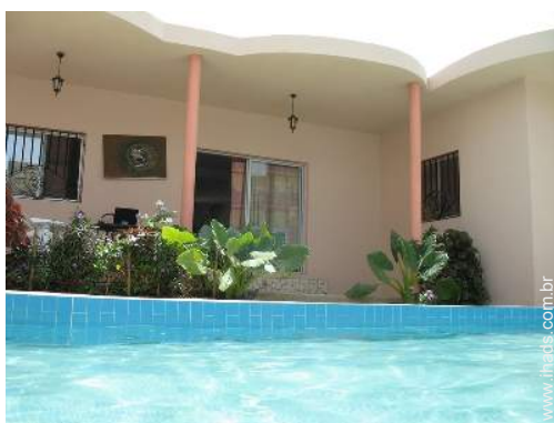
vista a partir da piscina