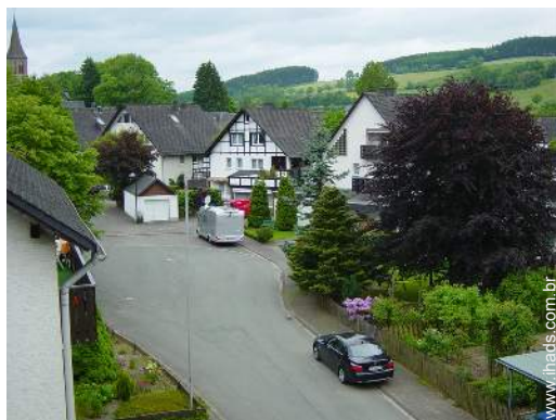
vista a partir do apartamento