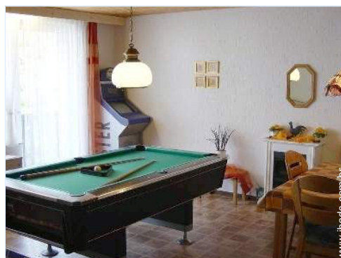
mesa de bilhar