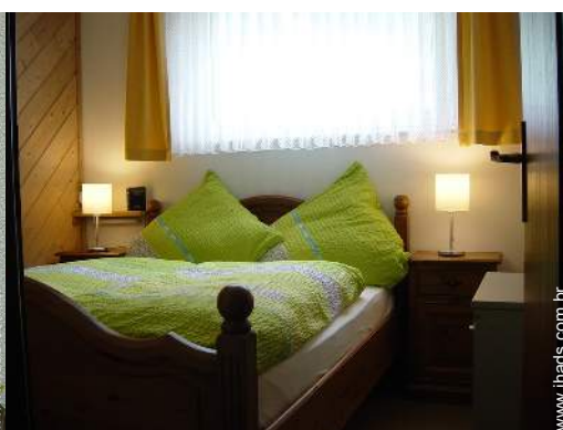
Dormida - cama(s)