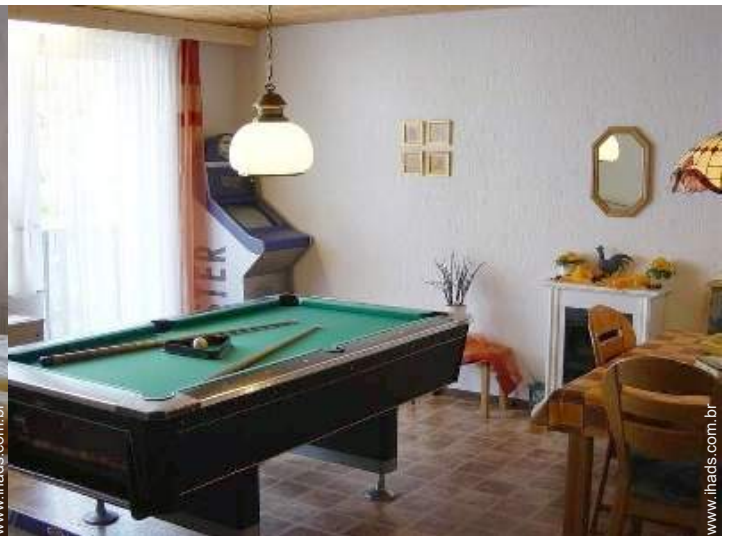
mesa de bilhar