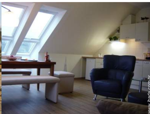
Divisões e comodidades