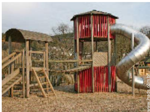
infraestruturas de lazer