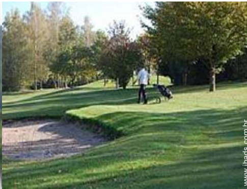
campo de golfe 18 buracos