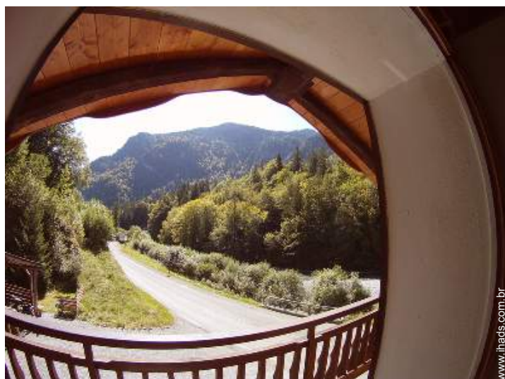
vista para rio