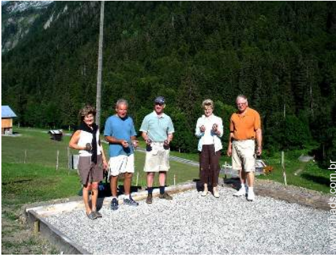
terreno de petanca