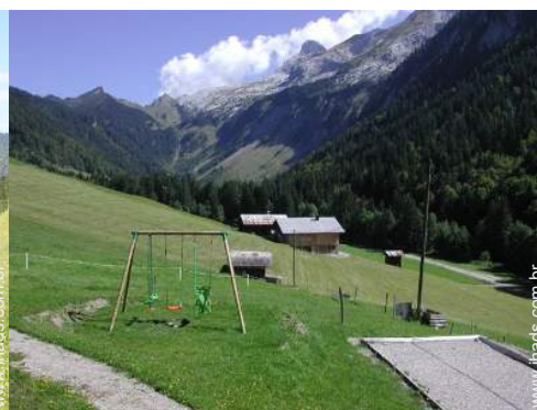
baloiço para criança