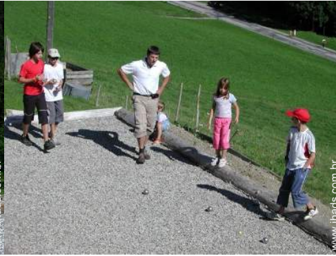
terreno de petanca