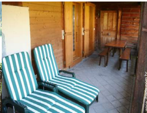
cadeira(s) de praia