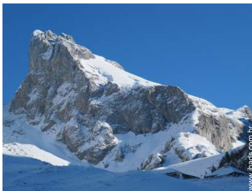
atividades de montanha nas proximidades