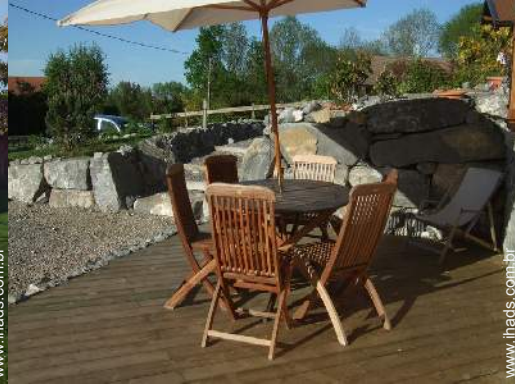
salão de jardim