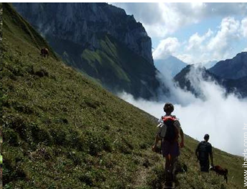
atividades de montanha nas proximidades