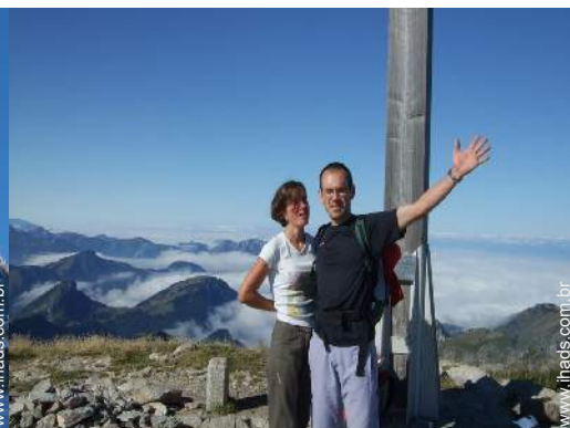
atividades de montanha nas proximidades