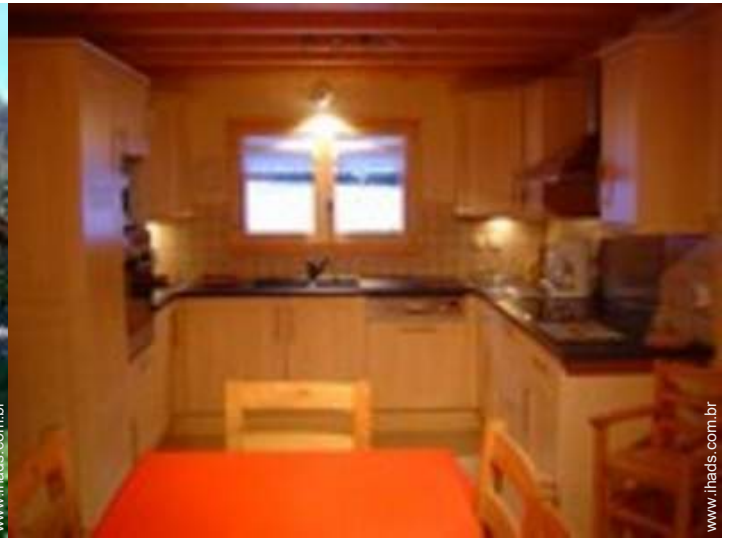
grande cozinha americana