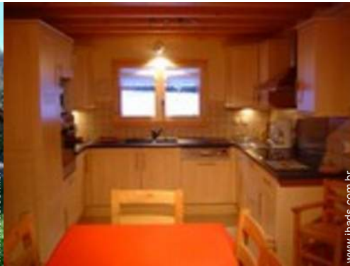
grande cozinha americana