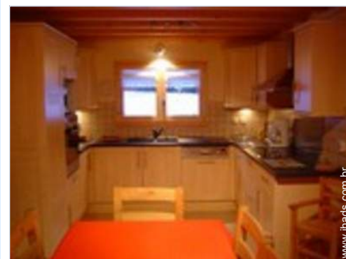
grande cozinha americana