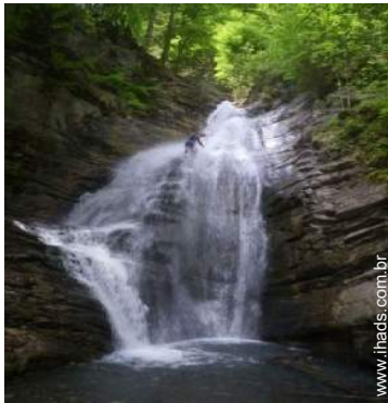
caminho de passeio