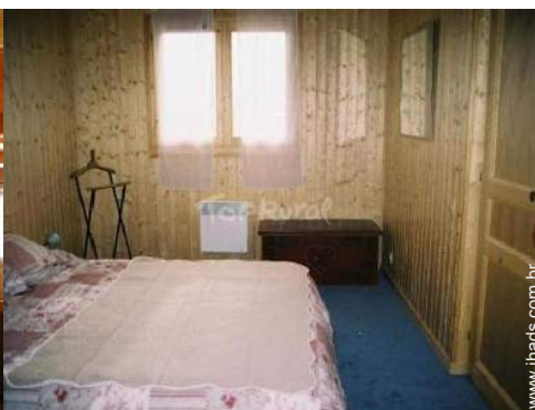
quarto do proprietário