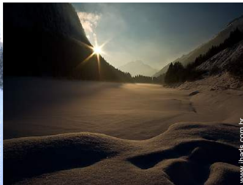
actividades de inverno nas proximidades