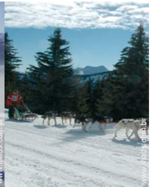
trenó com cães