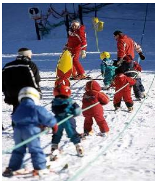
escola de esqui