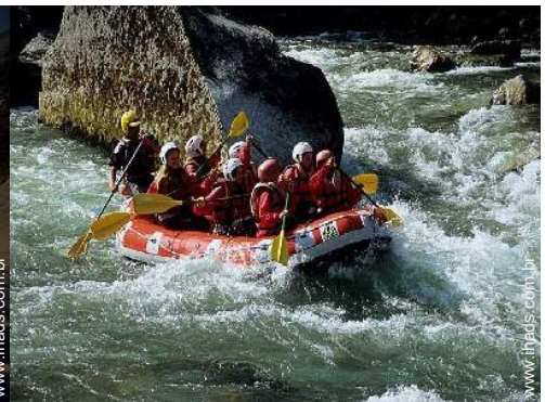
actividades de verão nas proximidades