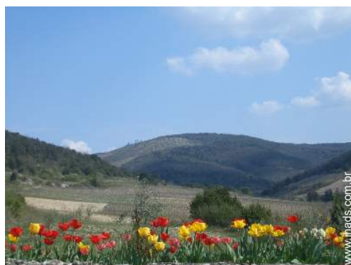
vista sobre vinhas