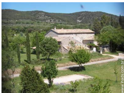
Mas de Encanto