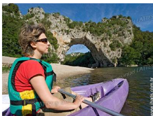
actividades náuticas nas proximidades