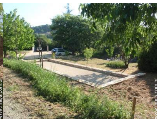
jogos de petanca