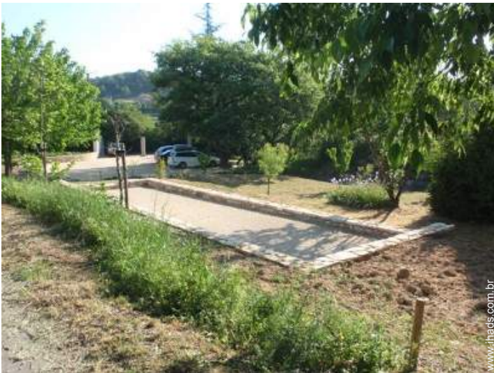
jogos de petanca