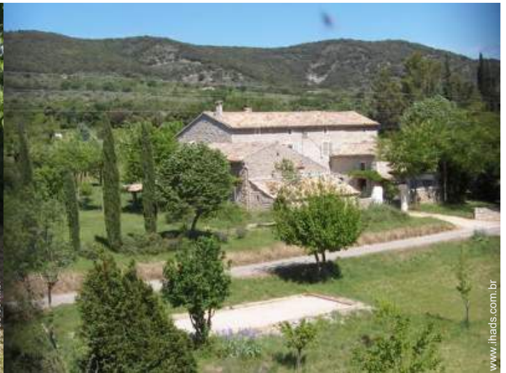
Mas de Encanto