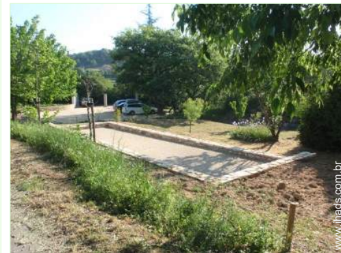
jogos de petanca

- Centro aldeia 4km - Aluguer bicicletas/BTT 4km - Aluguer de moto/scooter 4km - Padaria 2,5km - Pequenos comércios 2,5km - Supermercado 4km - Lojas de luxo e marcas 4km - Cabeleireiro 4km - Cyber café 4km - Correios 2,5km - Banco 4km - Caixa automático multibanco 4km - Farmácia 4km - Médico 4km - Enfermeira 4km - Hospital 25km