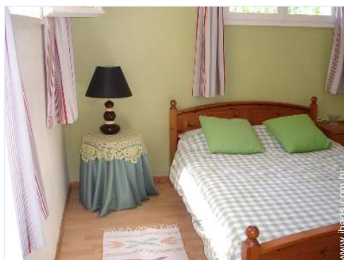
Dormida - cama(s)