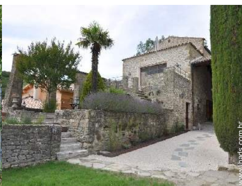
Casa provençal de luxo