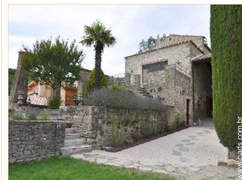
Casa provençal de luxo