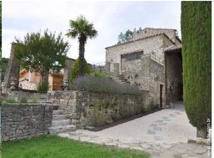
Casa provençal de luxo