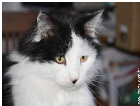
Os animais da casa