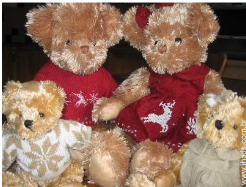
Os seus hóspedes