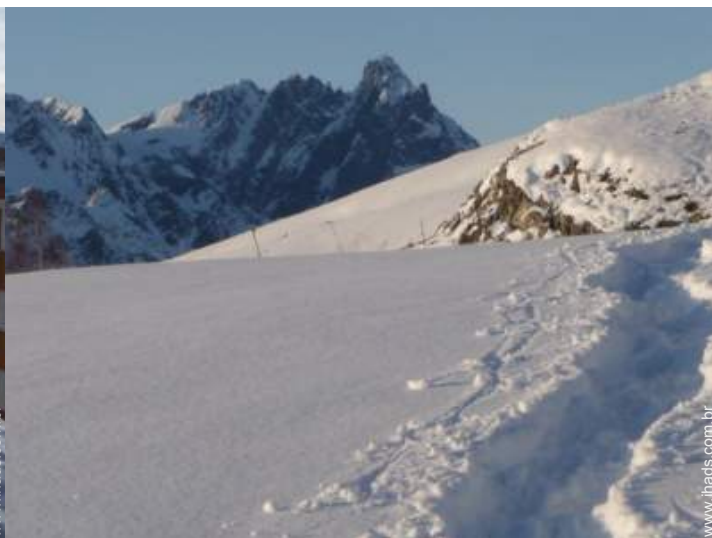
caminho de passeio