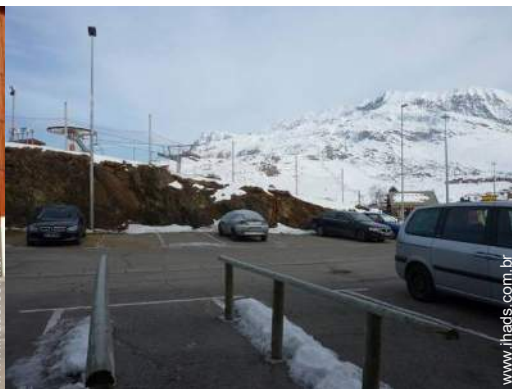
lazer mecânicos nas proximidades