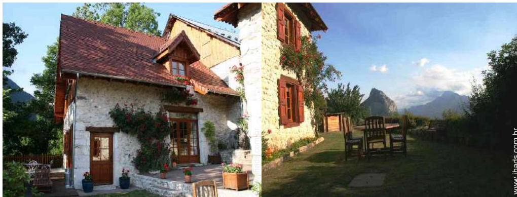
Casa de Encanto de pedra