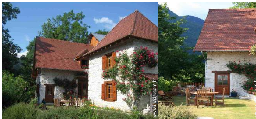
Casa de Encanto de pedra