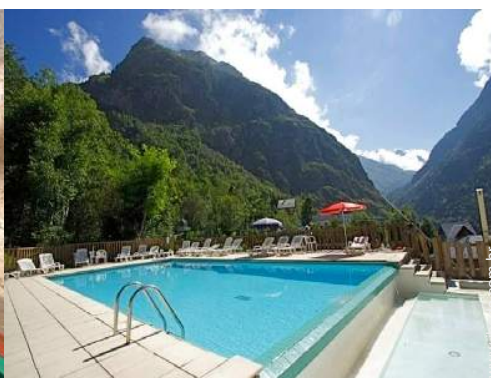
piscina na residência