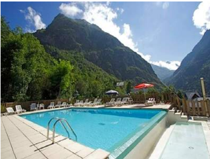
piscina na residência