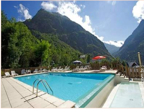
piscina na residência