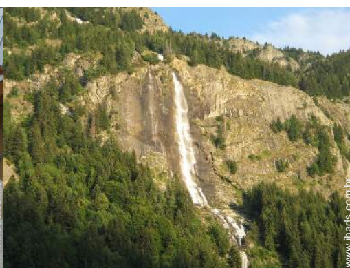
vista a partir do varandim