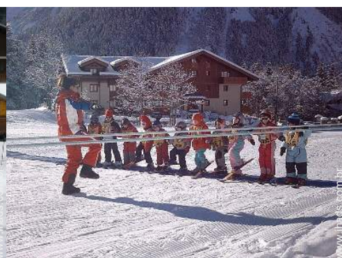
vista a partir do varandim