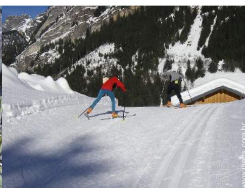
passeio de esqui