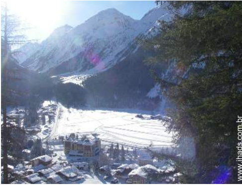
passeio de esquí