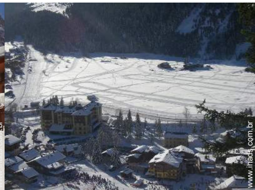
esquí fora de pista