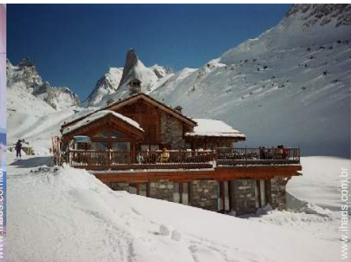
vista de serra