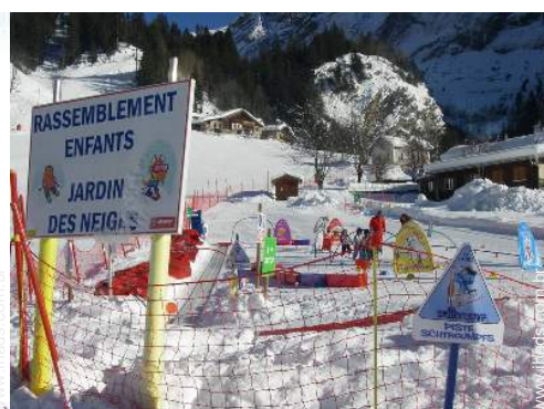
clube de esqui para criança