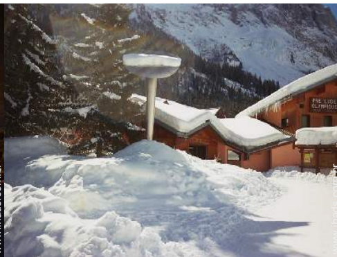
patinagem sobre gelo