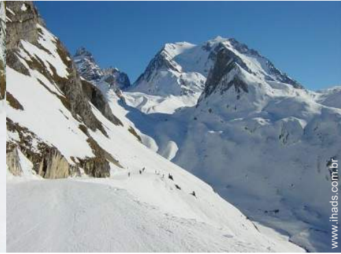
pistas de esquí