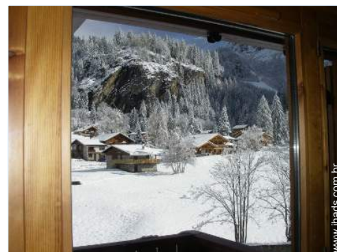
vista a partir da sala de estar

Pátio privado 1000m 2 , terreno fechado 1000m 2 , relvado 1000m 2 , rio, fonte, cascata