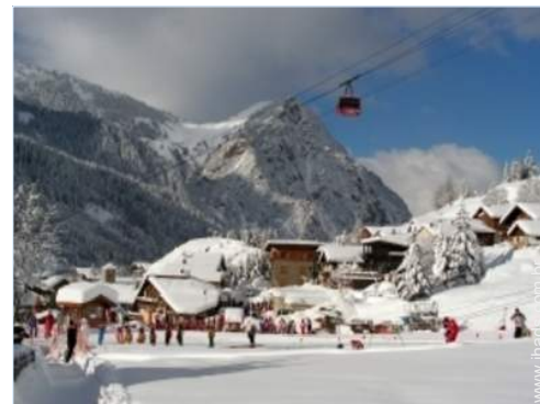
visão de conjunto