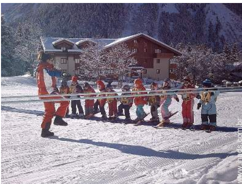
escola de esquí