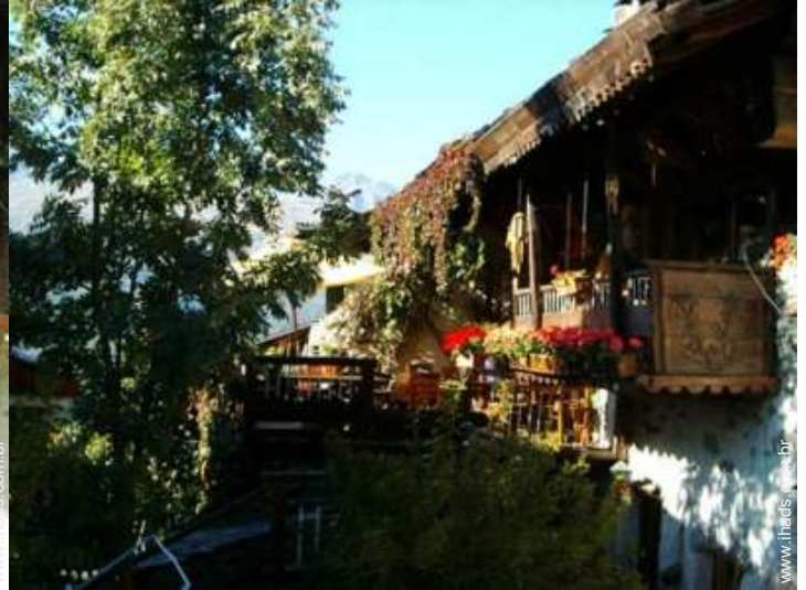
Chalé de Encanto em madeira