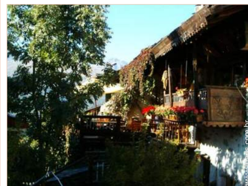
Chalé de Encanto em madeira