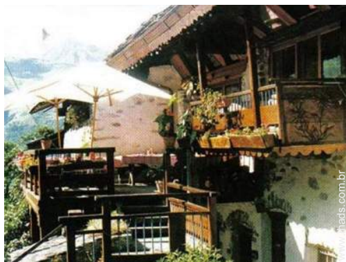
Chalé de Encanto em madeira