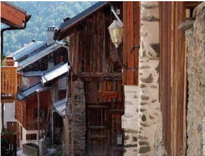
Antigo celeiro de Encanto