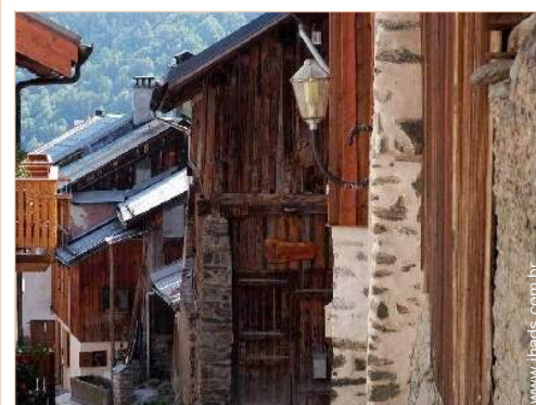
Antigo celeiro de Encanto