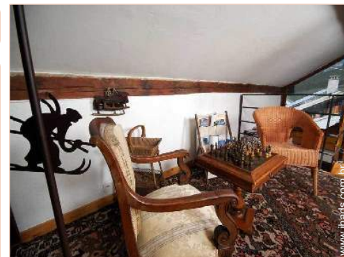
infraestruturas de lazer

Salão de verão, guarda-sol, 2 cadeira(s) de praia