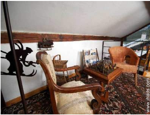
infraestruturas de lazer