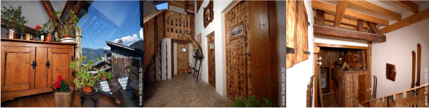
vista a partir da sala de jantar