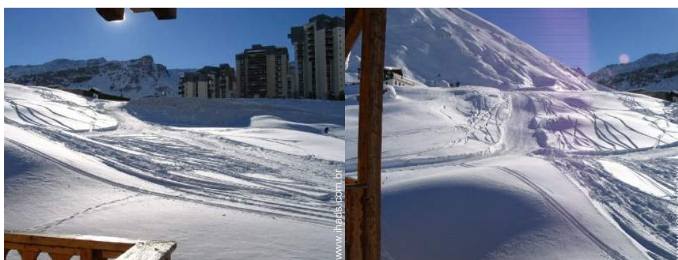
vista a partir do apartamento