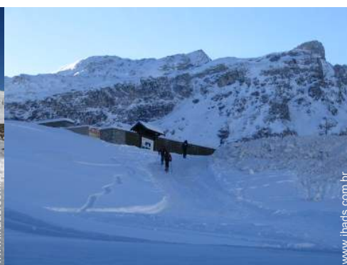
vista a partir do apartamento