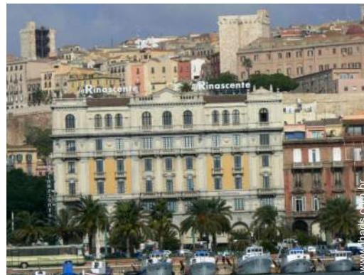
centro da cidade