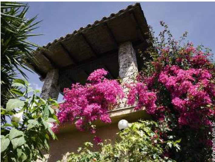
terraço no telhado