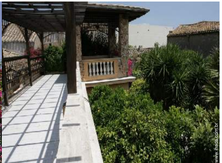
terraço no telhado