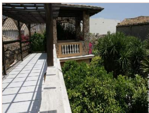
terraço no telhado

Pequeno-almoço, Preparação cesto piquenique possível como extra