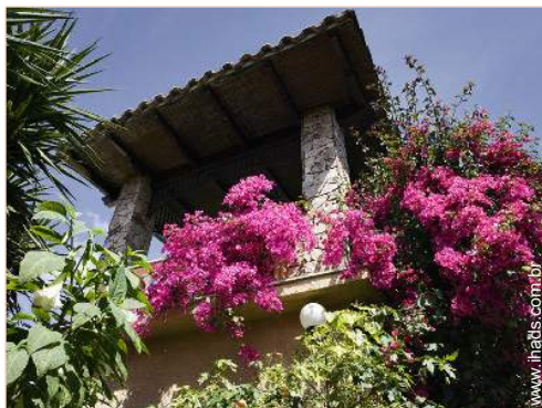
terraço no telhado