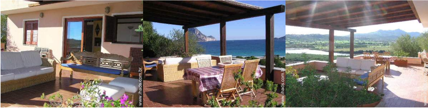
vista a partir da varanda