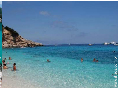
actividades balneares nas proximidades