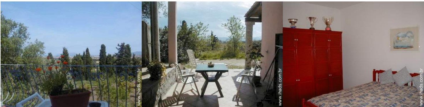
vista a partir da casa