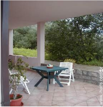
mesa(s) de jardim