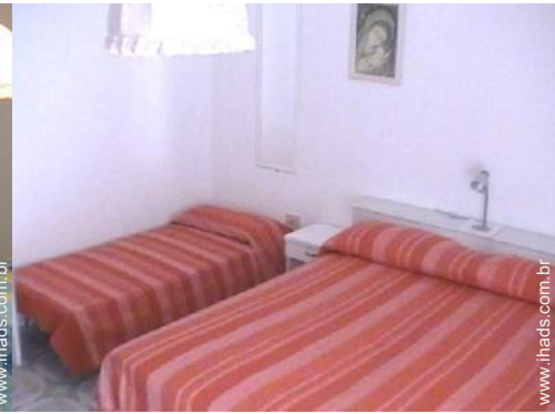
cama(s) de fechar individual