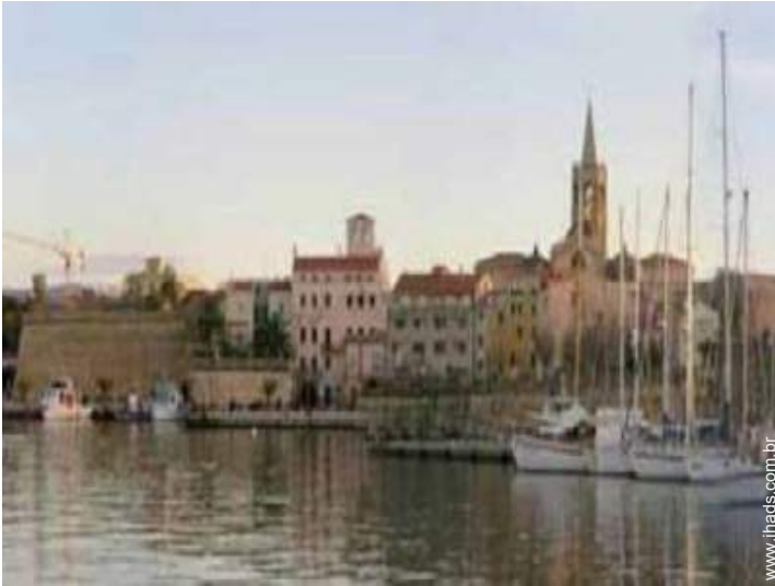
centro da cidade