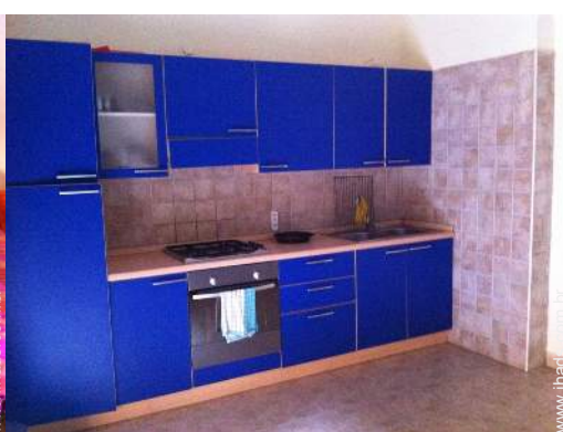
grande cozinha americana