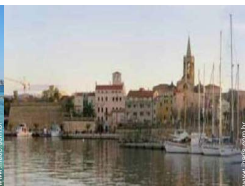
centro da cidade