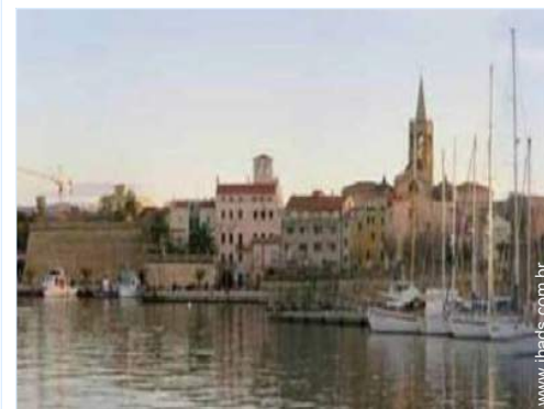
centro da cidade