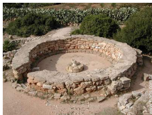
Atracções e lazer