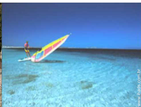
actividades náuticas nas proximidades