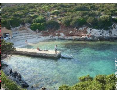
mergulho com tubo