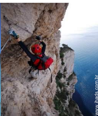
escalada em rocha