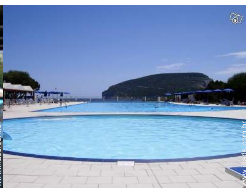
Piscina de água salgada