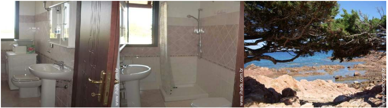
máquina de lavar roupa