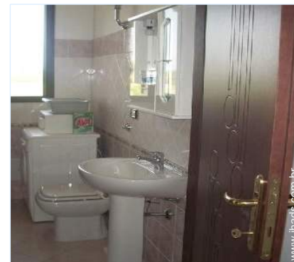
máquina de lavar roupa

Barbecue, mesa(s) de jardim, 4 cadeira(s) de jardim, 4 cadeira(s) de praia, duche exterior