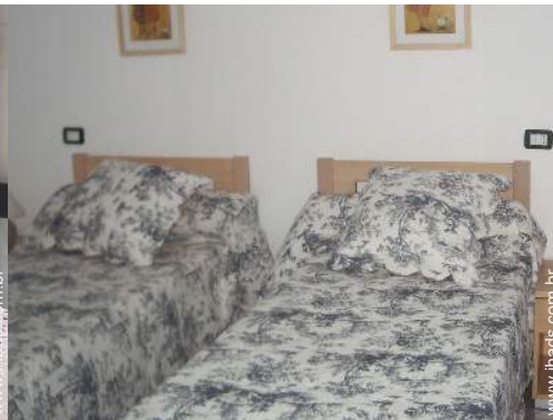
quarto de amigos