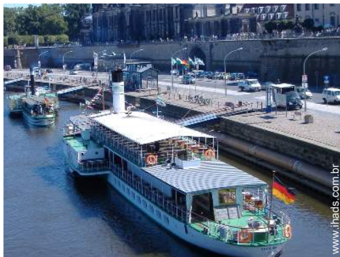
atividades de verão nas proximidades