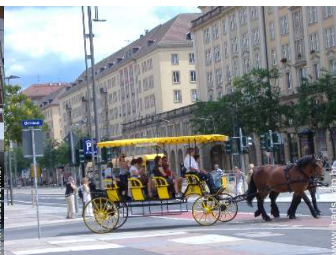
passeio de cahece