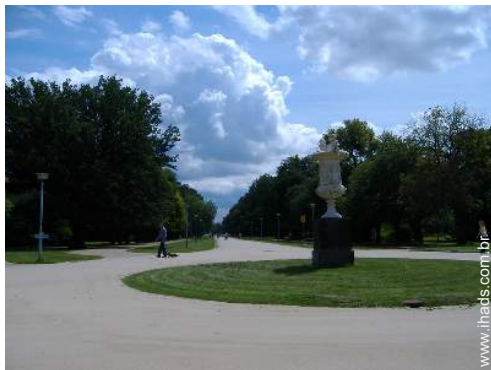
parque e jardim