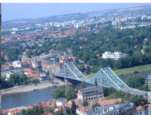
Atrações e lazer