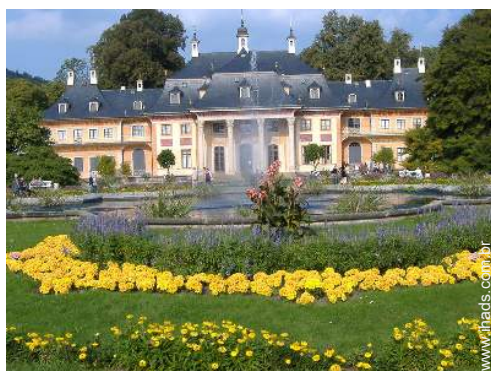
parque e jardim