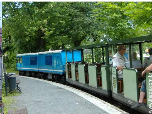
parque e jardim