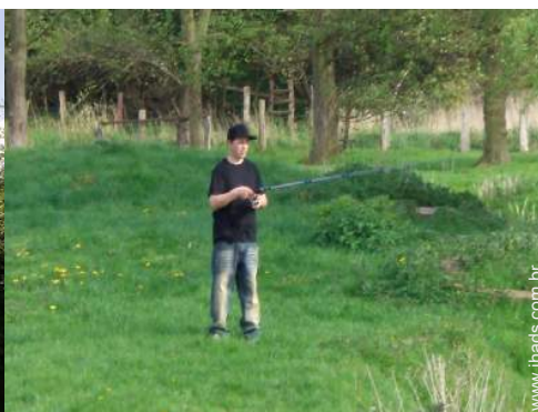
pesca à linha