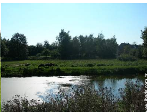
vista para lago