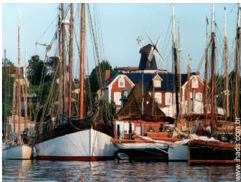
lazeres mecânicos nas proximidades