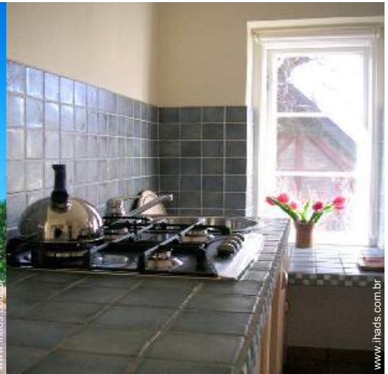
fogão a gás