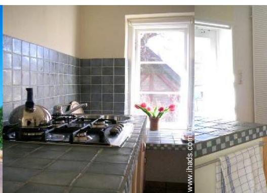
fogão a gás