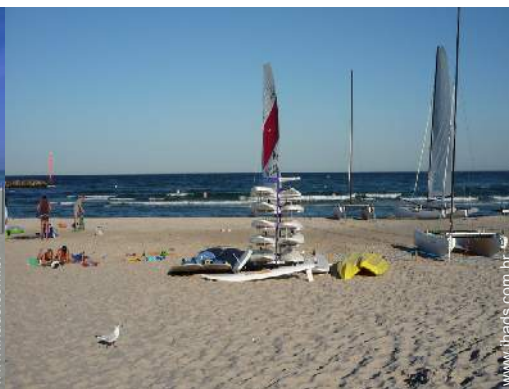
actividades náuticas nas proximidades