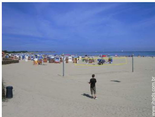
acesso directo à praia