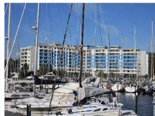
porto de recreio