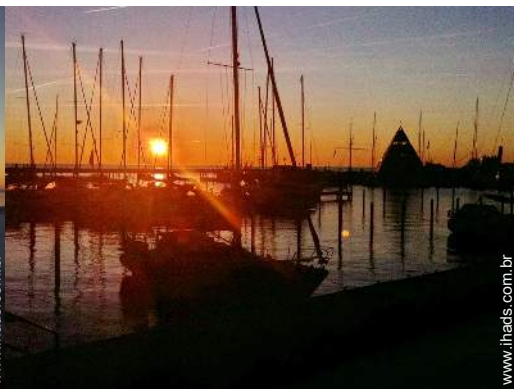
vista de porto