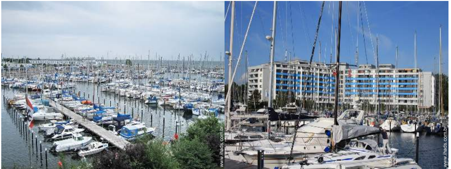
porto de recreio