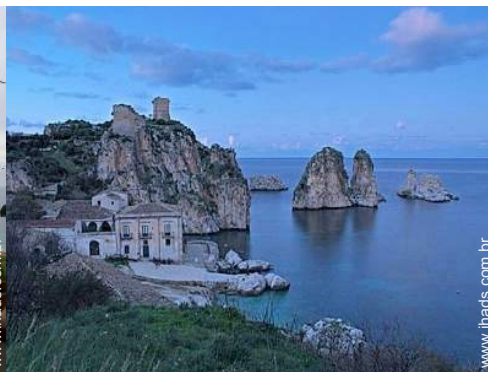
Cidades nas proximidades