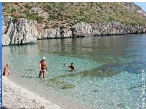
Cidades nas proximidades