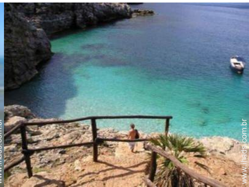
Cidades nas proximidades