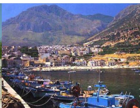
porto de recreio