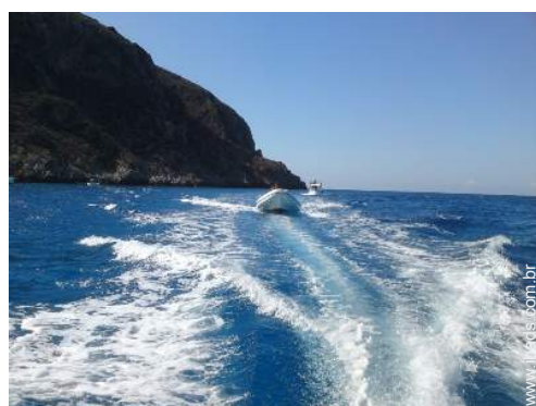
excursão de barco