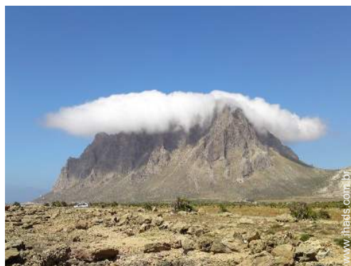
escalada em rocha