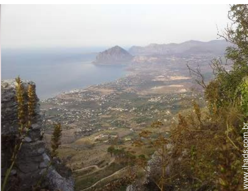
BTT (itinerário circuito)