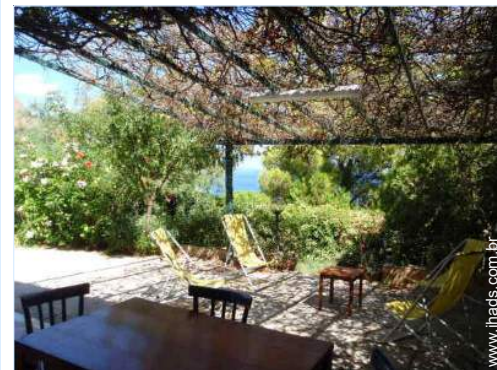
vista a partir da varanda