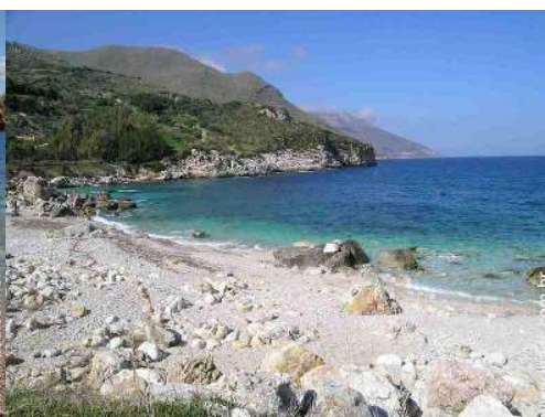
vista de mar