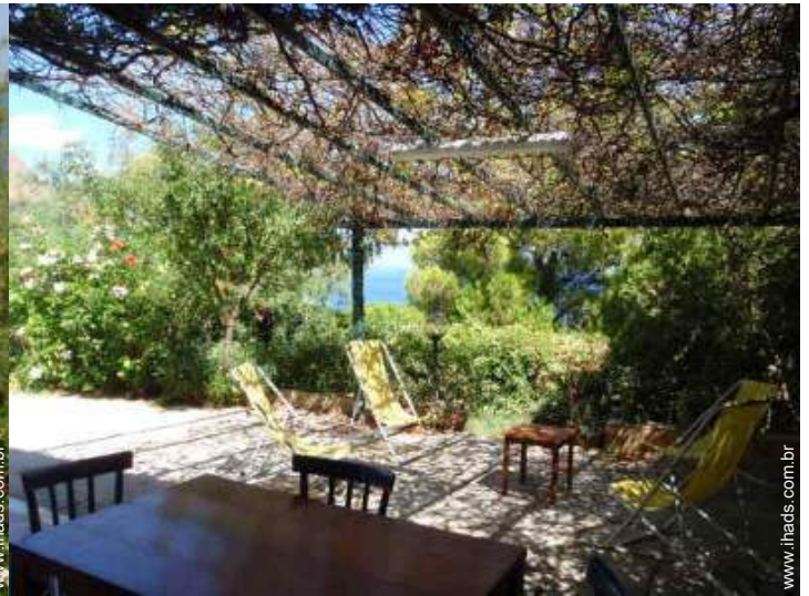
vista a partir da varanda