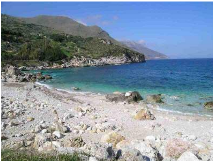
vista de mar