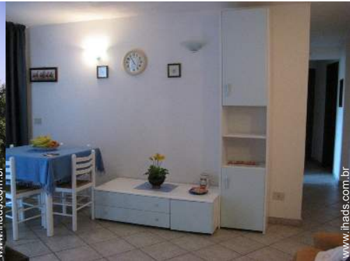
vista a partir da casa