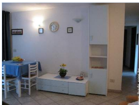
vista a partir da casa