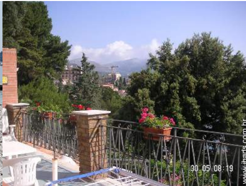
vista a partir do terraço