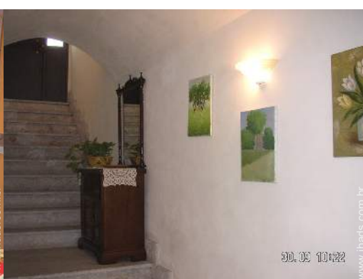
visão de conjunto