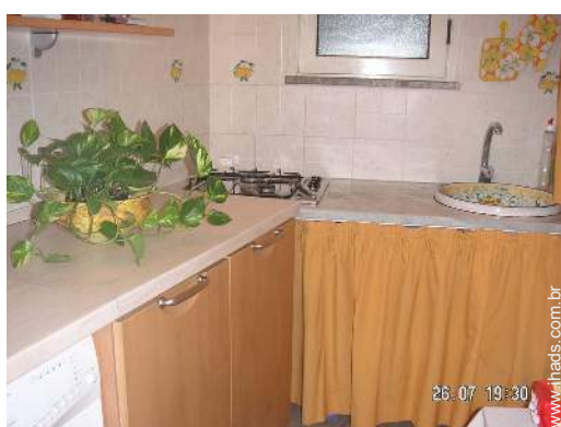
vista a partir da cozinha