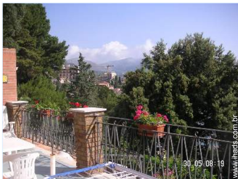
vista a partir do terraço