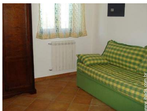
sofá(s) cama 2 pessoas