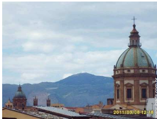
vista a partir do varandim