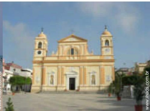
centro da cidade