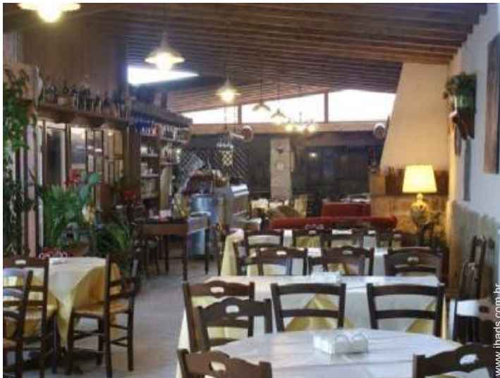
Divisões interiores à disposição dos hóspedes