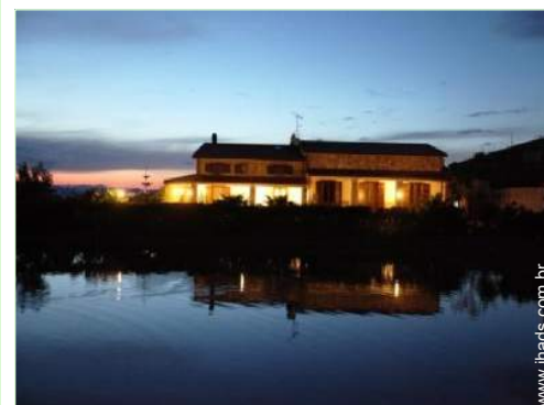
vista para lago