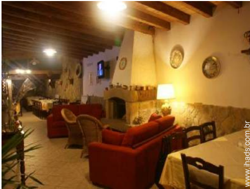
Conforto interior à disposição dos hóspedes