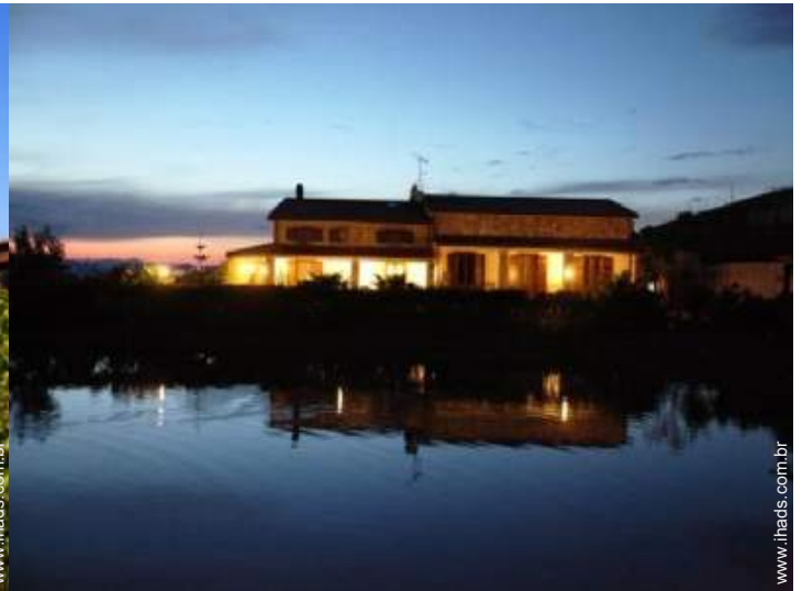
vista para lago