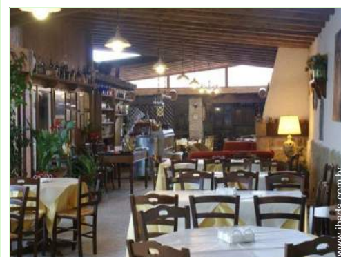
Divisões interiores à disposição dos hóspedes