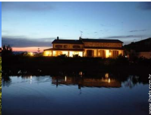
vista para lago