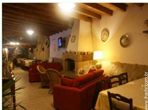
Conforto interior à disposição dos hóspedes