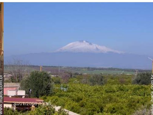
vista de campo