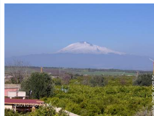
vista de campo