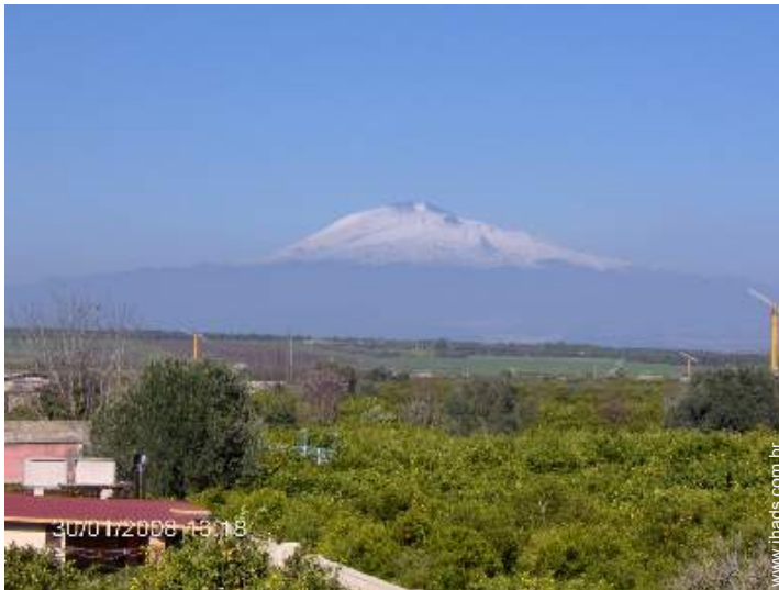
vista de campo